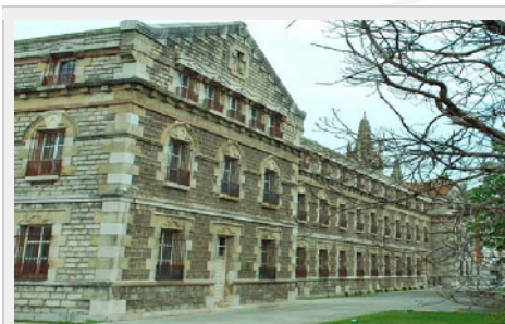
TSJ de Cantabria.

La Sala de lo Contencioso Administrativo del Tribunal Superior de Justicia de Cantabria (TSJC) ha desestimado el recurso de apelación promovido por el Servicio Cántabro de Salud (SCS) contra una sentencia de primera instancia que reconoce el derecho del personal sanitario estatutario interino a cobrar trienios.